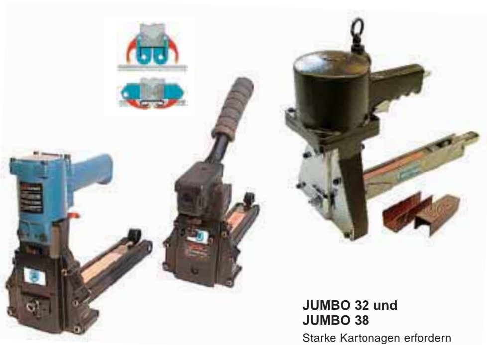
MEPA 18 P