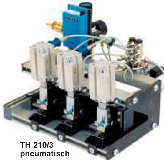
TH 210/3 pneumatisch

Die Heftauslösung erfolgt über einen bis 100 mm in der Tiefe verstellbaren Anschlag. In einer Sonderausführung kann anstelle des verstellbaren Anschlages auch eine Heftauslösung über ein Fußventil erfolgen. Ab der 2. pneumatischen Hefteinheit ist jeder weitere Hefter durch Schiebventil einzeln abstellbar. Bei den elektrischen Tischheftern durch Steckerverbindung.