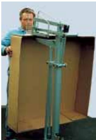
ST QE 535 P pneumatisch

Sonderausführung mit 400 mm höherer Säule. Nutzhöhe = 1350 mm. Klappenheftung von großen Kartontrays.