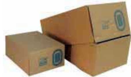
Boden- und Deckelteil miteinander verheften.