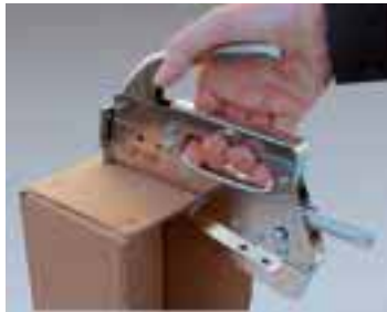
Deckelteil Laschenfaltung nach innen.