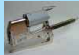
130/1916 PUX mit verlänger- tem Magazin für 250 Heft- klammern.

Pneumatische Zangenhefter können auch mit umgedrehtem Auslösehebel geliefert werden, so dass mit der Einschuböffnung nach unten geheftet werden kann.