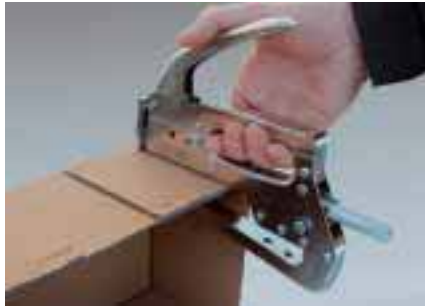
Bodenteil: Laschenfaltung nach außen!

Beispiel aus der Praxis: Vom Kartonzuschnitt zur versandfertigen Stülpschachtel: